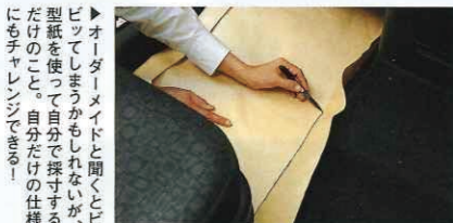
▶オーダーメイドと聞くとビビってしまうかもしれないが、型紙を使って自分で採寸するだけのこと。自分だけの仕様にもチャレンジできる!

「いりません！」といっても、新車購入時に買わされてしまつこともある純正のフロアマット。車種専用設計でフィットイングは抜群だが、なんせ地味でつまらない。その点、アフターパーツのマットはカラフルだし、素材にもこだわって、カスタム派のハートをガッチリつかむキャラクター。必要に応じてラゲッジのマットなども追加できるし、オーダーメイドタイプなら、自分だけのコーディネートにこだわることだって可能。今お使いの純正マットがくたびれてきたという方、ここで気分一新、カスタムフロアマットにしてみてもいい?