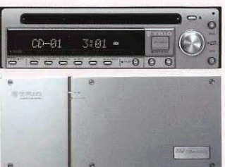
CDチューナー「K-TR10D」+モノラルアンプ「K-TR10A」4台 59万8500円