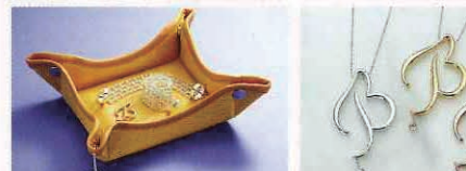
「Blossom EXECUTIVE LINE ミニアクセサリーケース」7140円。 「Blossomラグジュアリー」ゴールド、新感覚の内装アイテム「Blossomグリップハンドル」3個入り7350円。 Blossom ☎043-460-0777 http://www.g-blossom.co.jp

鏡面とヘアラインが選べる「Blossomビラー」で手軽に高級感をプラス。室内には「Blossom EXECUTIVE LINEグリップハンドル」を加えて、こちらも質感アップを狙おう。ルームミラーからは「Blossomラグジュアリー」を下げてもいい? スッキリとしたセブ的なコーディネートが完成。