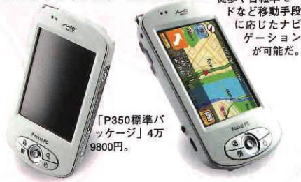
マイタックジャパン ☎03-5763-8499 http://www.mitac.co.jp

GPSモジュールとアンテナを内蔵したハンディタイプのモバイルナビゲーションシステムのNEWモデルが6月中旬から登場予定。1GBメモリ搭載で音声ナビソフトもインストール済み。