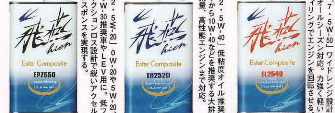
SONIX Co.,Ltd ☎042-542-9812 http://www.hien.jp

日本での使用実態をふまえた0W、5W、10Wの中間に位置する「2.5W」と「7.5W」という新しい動粘度を採用した省燃費オイル。例えば「2.5W」ならば0Wと5Wをカバーできるため低温時のオイル性能が底上げされる。さらに高温時でも安定して性能を発揮。ひとつのオイルで従来より幅の広い使用環境に適應できるものを、という発想から誕生した。余らず使える1L入りで、各2205円。