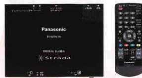
パナソニック ☎0120-50-8729 http://panasonic.jp/car/

薄さ27mm、動作時の消費電力8Wの地デジチューナー。高速走行時の12セグ受信性能は従来品の1.6倍に向上させた。6万2790円。