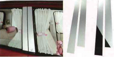
「Blossomビラー」まぶしく輝く鏡面タイプ2万3100円と、落ち着いたヘアラインタイプ2万4150円。