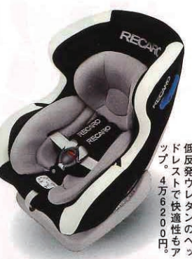
レカロスタートコール ☎0800-919-1906 http://www.recaro.jp/child

昨年10月からヨーロッパで新安全基準が導入されたチャイルドシート。「レカロスタートプラスアイ」は、緊急時には1回の操作でベルト解除ができ、しかも幼児には自力でバックル操作できない設計といった新基準に対応している。