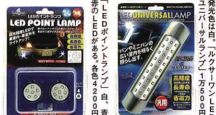
ビアーレムトウワン ☎048-653-8491 http://www.brm21.com

「LEDポイントランプ」は防水加工が施され、エクステリアにも使えるLED汎用ランプ。表面塗装タイプのLED6球で明るく輝く。「LEDユニバーサルランプ」はスマートボディの室内用汎用ランプだ。