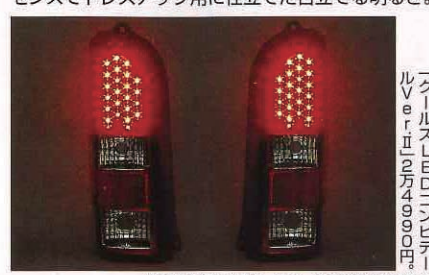
クールスLEDコンビテールVer II ¥49900円 カスタムショップクールス ☎0829-20-1551 http://www.jcools.com/funkycools

DA52/62エブリイ専用のLEDコンビテールが発売された。テールレンズで人気のクールスが、独自のセンスでドレスアップ用に仕立てた目立てる明るさ。