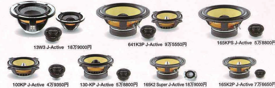
13W3 J-Active 18万9000円

マルチアンプシステムという日本独自のハイエンドカーオーディオ事情を考慮し、音楽を愛する日本のフォーカルユーザーのためにフォーカル社とアルファが贈る日本限定モデル。フォーカルドライバーの威力を余すことなく発揮し、性能とコストパフォーマンスを両立させた全7モデルで新しいシステム作りに挑んでみては。