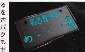
ウインコーポレーション ☎052-351-0930 http://www.jin.ne.jp/win

ムラなく発光できるEL発光体フィルムを含む本体はその薄さ3mm。純正ナンバーフレームやフックを流用でき見た目もスッキリと。2枚セット2万1000円。