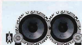
富士通お客様相談窓口 ☎078-682-7202 http://www.fujitsu-ten.co.jp

AV一体型ナビや最新カーオーディオの性能を最大限に引き出してくれる交換用スピーカー。3万4500円。