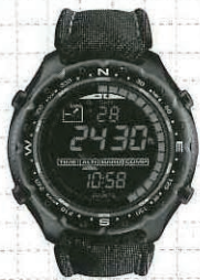
スト70周年記念モデル