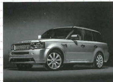
レンジローバースポーツ限定車