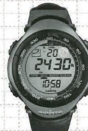
ストニューカラー