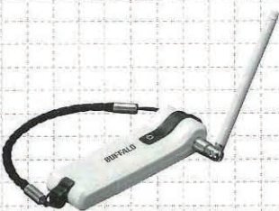
PC用ワンセグTVチューナー

問い合わせ: バッファロー http://buffalo.jp/download/photo/leaf.php?name=DH-ONE/U2