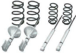
三菱コルト用サスペンションキット