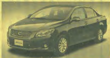
▲ちなみに9月29日から、レクサス車を対象にした残価設定型専用ローンもスタートしている

トヨタファイナンスが10月10日より、新型カローラ専用の残価設定型クレジット「らくちんカローラクレジット」のプラン受付を開始した。同社ではこれまでも支払額可変クレジットなど、多様化するニーズに対応したクレジットを提供してきたが、今回のプランはより多くのユーザーに応えるべく、通常の「毎月払い」に加え、トヨタ初のプランとなる2カ月に1回の支払いを可能とした「隔月コース」を設定。年金受給月に合わせた支払いや、貯蓄・家族のイベントなどに所得を振り分けたいといったニーズにも対応。また、支払い最終月に残存価値相当額(残価)を設定し、無理のない返済プランを実現したこともポイント。対象はカローラアクシオ/フィールダーのすべて。