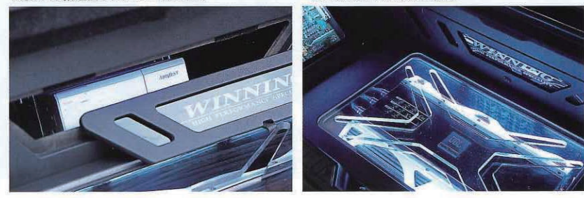
↓ラゲッジ奥のパネルを外せばCDチェンジャーにアクセスできる。見せる部分は見せ、隠すものは隠す。簡単なようで難しい取捨選択もサラリと正確にこなす ↓トランク内の普段は見えないスペースだが、きっちり作り込むのが正しいオーディオカーの姿。ネオン管も装備され、ここぞの見せ場で威力を発揮