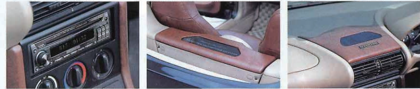
↑落ち着いたデザインと確かな音質で選んだヘッドユニットはアゼストDRZ9255。モニターレスの環境で純粋に音楽を楽しむための逸品 ↑本来は小物入れのスペースだがウーファーの設置と同時にネオン管を仕込み、ライトアップ用のエリアに。ブラウンレザーでの彩りも重要 ↑ダッシュボードのカラーバランス調整のために設けたレザーパーツ。小さな面積だが、ここに色が入ると入らないのでは印象が激変する