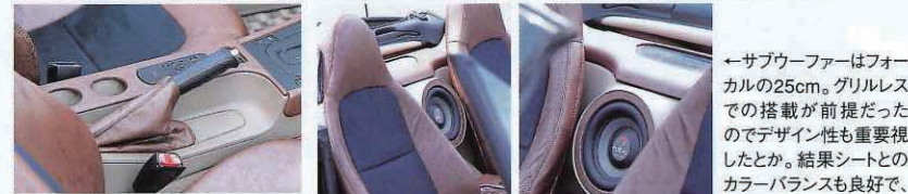
↑サブウーファーはフォーカルの25cm。グリルレスでの搭載が前提だったのでデザイン性も重要視したとか。結果シートとのカラーバランスも良好で、全体のイメージを崩さない自然なインストールへとつながった。バックパネルとの関係も完璧だ ↑サイドブレーキカバーもブラウンレザーで製作。ロックボタンも黒樹脂からクロームパーツへと変更し、細かい部分から上質な雰囲気演出