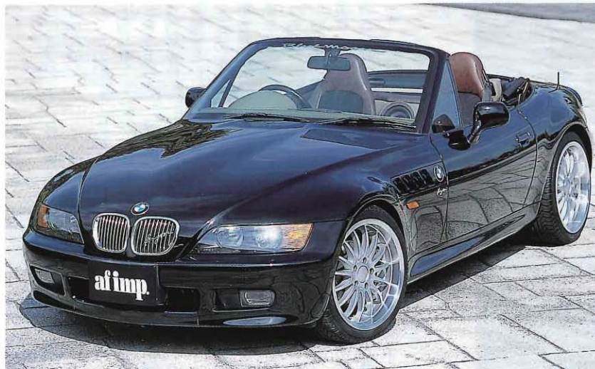
←ホイールはブレイトン・マジックの18インチ、ビルシュタイン車高調、インテリアのカラーにあわせて新調した幌と、外装もソツなくまとめている。アンサーマフラーの出口形状（W出し→シングル出し）に合わせてリアバンパーのカットラインも加工済みだ