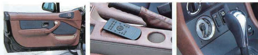
↑シートと同素材で張り替えたドア内張りだが、ポケット部にベージュの樹脂色を残しているのがミソ。フロアなどとの調和を考えた結果だ ↑後付けドリンクホルダーは絶対に嫌！とセンターコンソール部にワンオフで組み込む。同時にリモコン収納部も設けてスマートな空間に ↑この年式のZ3には時計がない。が、それを逆手に取ってエスカーレド用の純正パーツであるブルガリをインストール。女性ウケ良さそう

例えばドア内張り。色の切り返しは純正のバターンを活かして中央部をブラックアルカンタラ、外周部をブラウンレザーに。偶然にもシートの構成とまったく同じだが、これも福井サンにとっては計算済みのコト。ただしポケット部にはみ元のベージュ樹脂色を残して、他パーツとのバランスを保つ