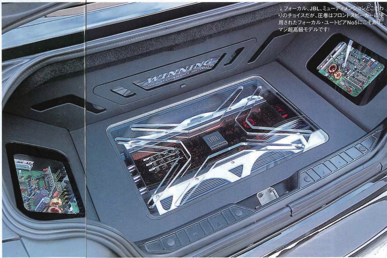
↓フォーカル、JBL、ミュージアム・システムとこだわりのチョイスだが、圧巻はフロントスピーカーに使用されたフォーカル・ユートピアNo5にこそあり、マン超高級モデルです！

ことは忘れなかった。これはベージュの樹脂が大量に使われているこのZ3の特性に合わせたもので、仮にドア内張り全面を完璧にレザーで巻く、ドアだけが完成して「浮いて」見えてしまふことを嫌った結果でもある。もちろんダッシュボードからリアバルクヘッド前のパネルまで、目に入るすべてをレザーでカバーするのにも手はたろ。しかしコストは2倍3倍と飛躍的に高騰してしまうし、結局はフロアに敷き詰められていくベージュ色のカーペットまで気になってしまふ。要するに限りがないのだ。特に一度火がつくとトコトコまでイジってしまふ性格（トレイルブレイザーの例を見ても明らか）