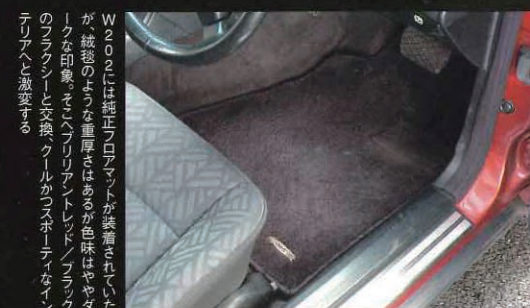
W202は、フロアマットが装着されているが、縁の部分が厚みがあるため、色味はややダークな印象。また、ペリリアントレッド、ブリリアントブルーのフラクシーと交換。クールカススポーツタイプは、テリクスと激変する

る違いと判断している。シザルがカジュアルで、フラクシーがスタイリッシュ、ウーリーが全体の間で、クロネがトラディショナル、クレストがシックという、メーカー公認のバリエーションになっている。