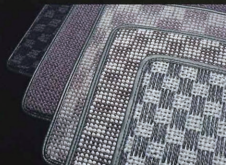
↑上からシザルで麻の硬い表面、フラクシーが毛足の短いカーペット調、より毛足の長いウーリー、ツイード調のクロネ、ボリューム感のあるクレストとなり、風合いは異なる