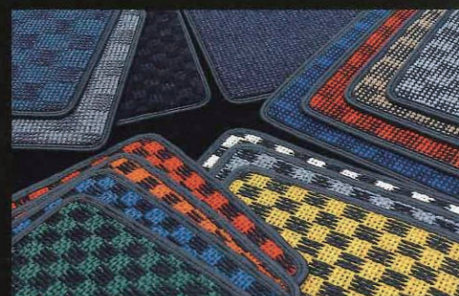
↑左上がウーリーの2色、その横がそれぞれ単色となるクレスト、クロネ。右上の4枚がフラクシーの4色、下が7色のシザル。これで全色のカラーバリエーションとなる

そのカロでは、5種類のシリーズを用意している。先に紹介した麻を使った「シザル」以外に、化繊タイプとなる「フラクシー」「ウーリー」「クロネ」「クレスト」がある。この違いは毛足の長さ違いや風合い、色味によ